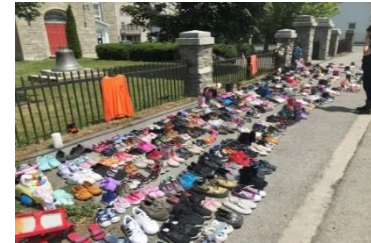
La découverte des sépultures anonymes suscite douleur et incompréhension.

Nous avons rassemblé quelques informations permettant de comprendre davantage la situation.